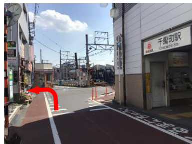
(2) セブンイレブンの手前を左折してください