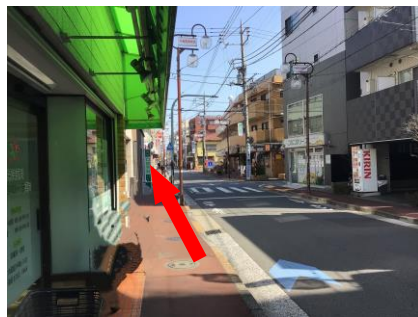
⑤ 直進してください