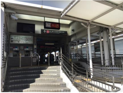
① 東急池上線・五反田方面を降りられた方は、階段を降りて、左（線路方面）へお進みください