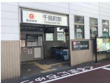
(1) 東急池上線・蒲田方面を降りられた方は、出て、右へお進みください