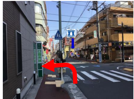
⑥ 右奥にローソンが見えたら、歯科・口腔外科の看板を左折してください