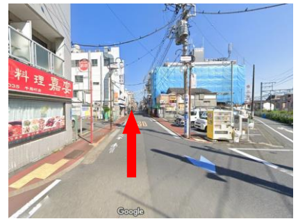
③ 直進してください