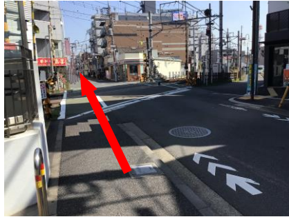
② 踏切を渡り、そのまま直進してください